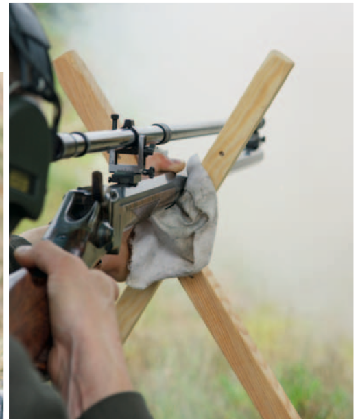
Ob mit ZF-bewehrter Western-Sharps oder modernem Präzisionsgewehr, die 600-Meter-Bahn in Ulfborg bietet für jeden Schützen eine sportliche Herausforderung.

nen, wie zum Beispiel bei dem inzwischen elften Quigley Shoot-off – also den nach dem Kinofilm „Quigley der Australier“ abgeleiteten Langdistanzschuss auf den Eimer (siehe dazu VISIER 10/2006). Zusammen ergibt das eine attraktive Mischung, die sich die Mitglieder des BDS-Landesverbandes 3, Niedersachsen und Bremen, seit vergangennem Jahr zunutze machen.